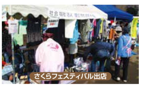
さくらフェスティバル出店

市民の皆様のご協力でたくさんの品物をバザーに提供していただいています。11月の最終日曜日に開催される市民福祉バザーでは、5日間かけて協力団体の方々とバザー部員とで楽しくおしゃべりをしながら仕分け、陳列、値付け等を行い、ドキドキの本番を迎えます。自分では使わない品物が他の人に買われ利用されて、それが福祉のお役に立つ、そんな喜びを感じながら活動ができます。あなたもバザー部員になってみませんか。