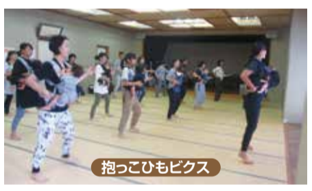
抱っこひもピクス

今年の10月で20周年を迎えようとしています。お子さんのとともかわいい様子が孫のようにも見えて微笑ましく見させていただいています。専門家指導によるベビーマッサージやお母さんがホッとする場として、また、交流の場として好評いただいています。これからも部員一同笑顔いっぱいでお迎えます。ぜひご参加ください。お待ちしております。