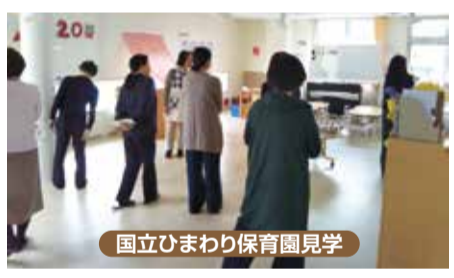
国立ひまわり保育園見学

お子様の健やかな育ちを願い活動している「子育て部会」は、今年で13年目を迎えます。大人気の夏の恒例行事「くにたち虫探したんけん隊」は、年毎に違う虫がデザインされた手作り缶バッジと共にバナナを発酵させたトランプに集まったかぶと虫のお土産付きです。おそば作り、スイーツ作り、園児、児童の現場で長年経験されたお話、親子のコミュニケーションについて等々、外部の講師をお招きしてお母様達との良い時間です。また、私達部員も立川ふじようちえん、高尾の森わくわくビレッジ、国立ひまわり保育園他をお訪ねして勉強しております。和やかに無理なく私達と一緒に活動してくださる方のご参加を部員一同大歓迎お待ちしております。