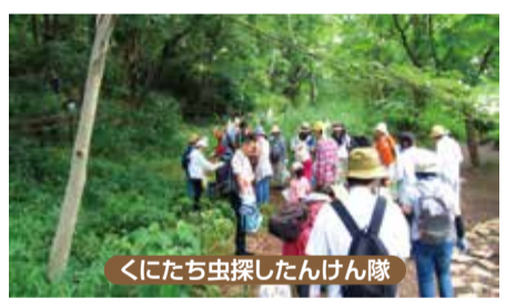
くにたち虫探したんけん隊