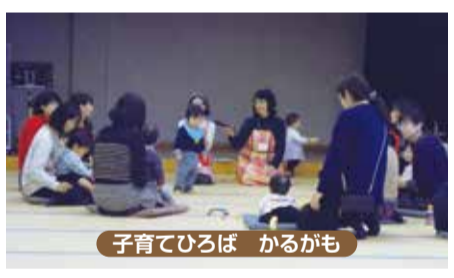
子育てひろば かるがも