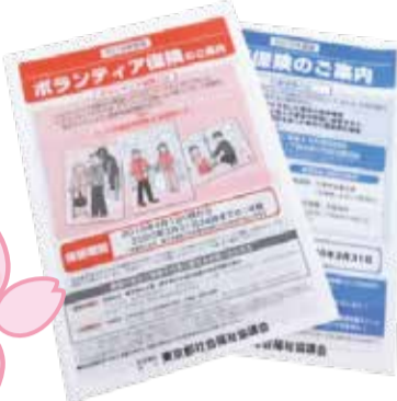
旧年度のパンフレット

また2020(令和2)年度のボラ ンティア保険の更新の手続きは3月9 日より受付を開始致します。活動をさ れている場合は、保険が切れ目なく補 償を受けるため、お早めにお手続き ください。