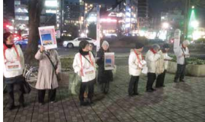
昨年度の街頭募金の様子↑

日時 12月20日(金) 午後5時~午後7時(予定) 場所 国立駅・谷保駅・矢川駅