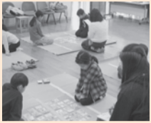
▲くにたちカルタ大会の様子

★問合せ ボランティアセンター (平日9時～17時) ☎042-575-3223