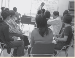
▲前回実施した傾聴ボランティア講座の様子

★締切 12月15日消印有効 ★申込 〒180-08555 国立市富士見台2-38 15 くにたち福祉会館内国立市ボランティアセンター