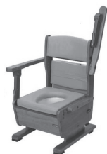
▲ポータブルトイレ