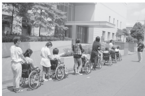
（オリエンテーションの様子）