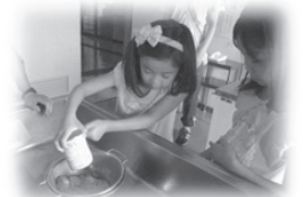
(上) 小学生のお子さんたちも準備のお手伝い。

7月29日(日)に国立市と協働で、避難者交流会「語(かたる)」を開催しました。今回は、日本ナザレン教団国立教会さんのご協力により、くになち福祉会館で流しそうめんを行ないました。1歳のお子さんから91歳の方まで参加があり、ほうれん草そうめん、さくら咲くそうめんといったくになちならではの麺も流したり、ミニトマトやフルーツなど彩のよいものと一緒に、ご参加のみなさまにも流すを手伝っていただいたり、昼食を楽しみながら交流を深めました。