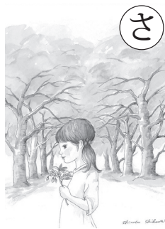
絵札作者：宿輪 忍生 （東京女子体育大学・東京女子体育短期大学教授）