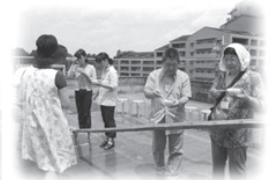
お天気もよく、打ち水で涼を取りながら流しそうめんを楽しみました。