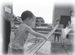
(左) 初めての流しそうめん。フォークを使って上手に食べられました。