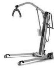
▲介護リフト 使用状況: きれいに使用 保管場所: 西 ※スリングシート無 パラマウントベッド製