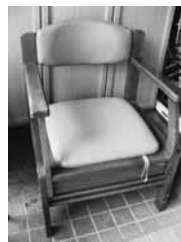
▲ポータブルトイレ 使用状況: ていねいに使用 保管場所: 西 ※内布タ無