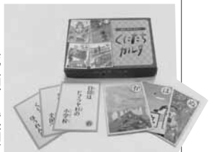
『くにたちカルタ』試作品↑ ※実際の仕様と異なる場合があります。